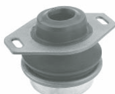
SWAG 64 13 0015 Ref. No. 1827.10