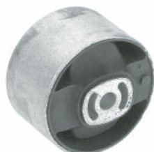
SWAG 64 13 0011 Ref. No. 1827.16