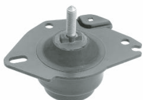
SWAG 57 13 0004 Ref. No. 41 65 510