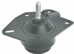
SWAG 57 13 0002 Ref. No. 87 86 006