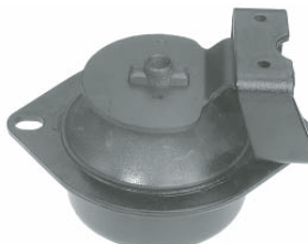
SWAG 57 13 0011 Ref. No. 75 76 333