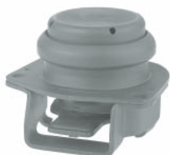
SWAG 57 13 0008 Ref. No. 41 65 494